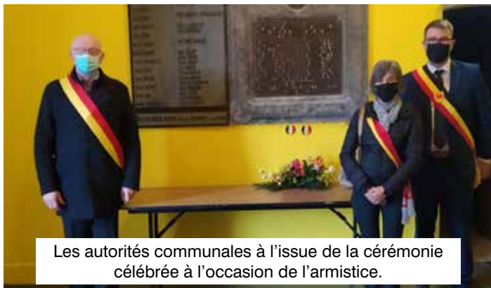
Les autorités communales à l'issue de la cérémonie célébrée à l'occasion de l'armistice.